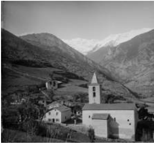
La Massana a principis del segle xx