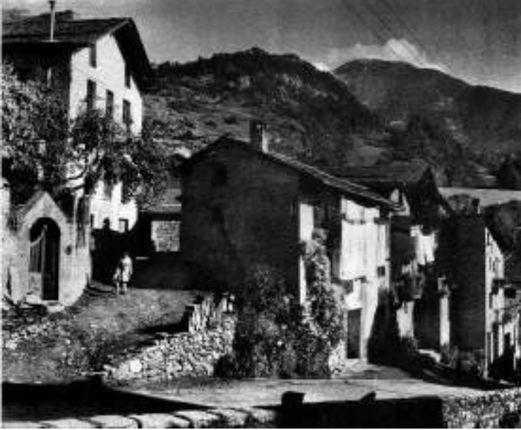
Casa Tadora a principis del segle xx