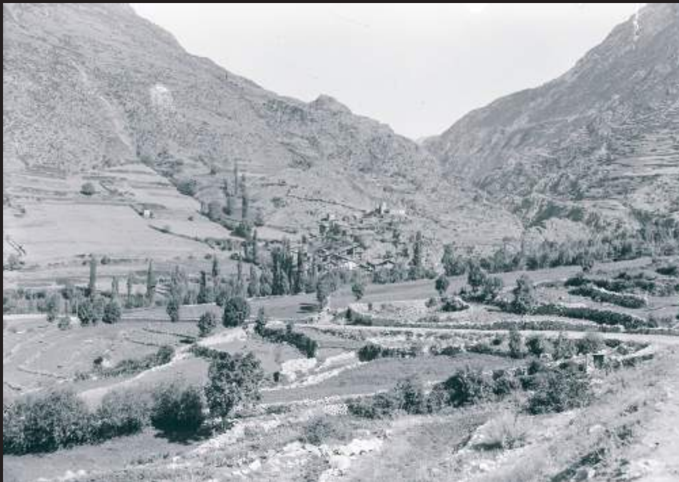
Vista general de les Bons (Encamp) cap als anys trenta del s. XX.