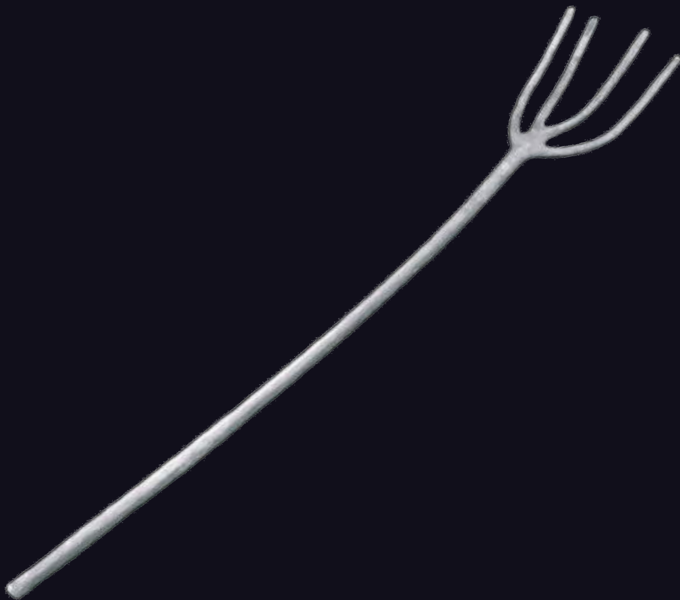
Forca de fusta.