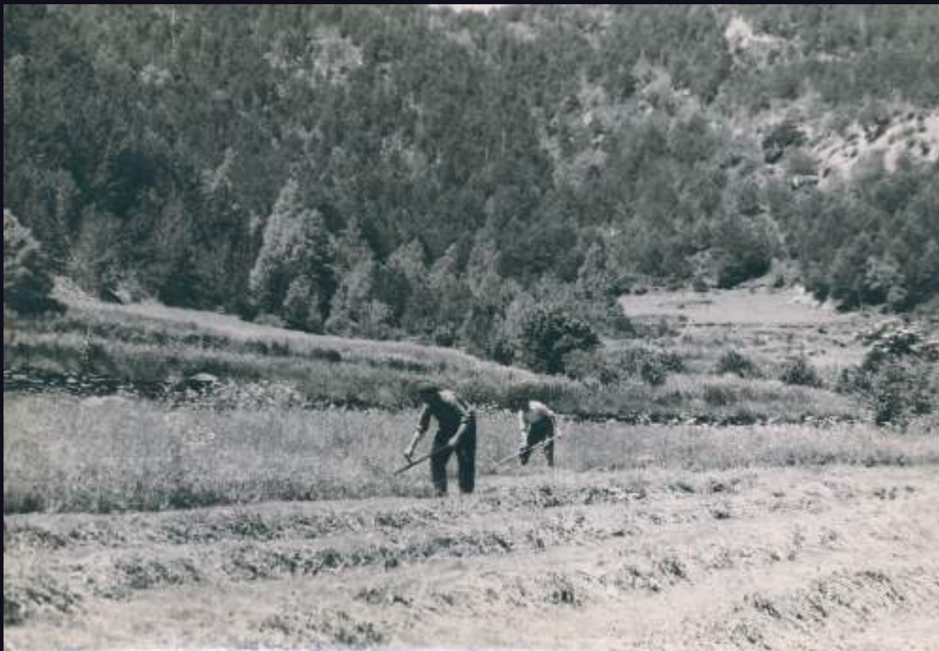
Dallaires dallant.